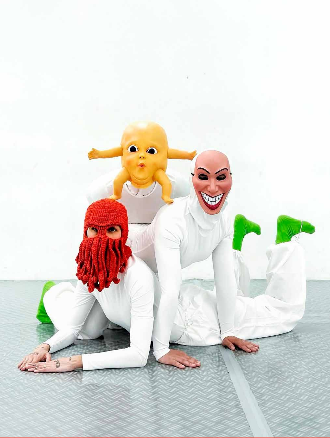
"LA CULPA", DE ELENA PUCHOL. OBRA GANADORA DEL PROGRAMA DE RESIDENCIA ARTÍSTICA TAI LANZA